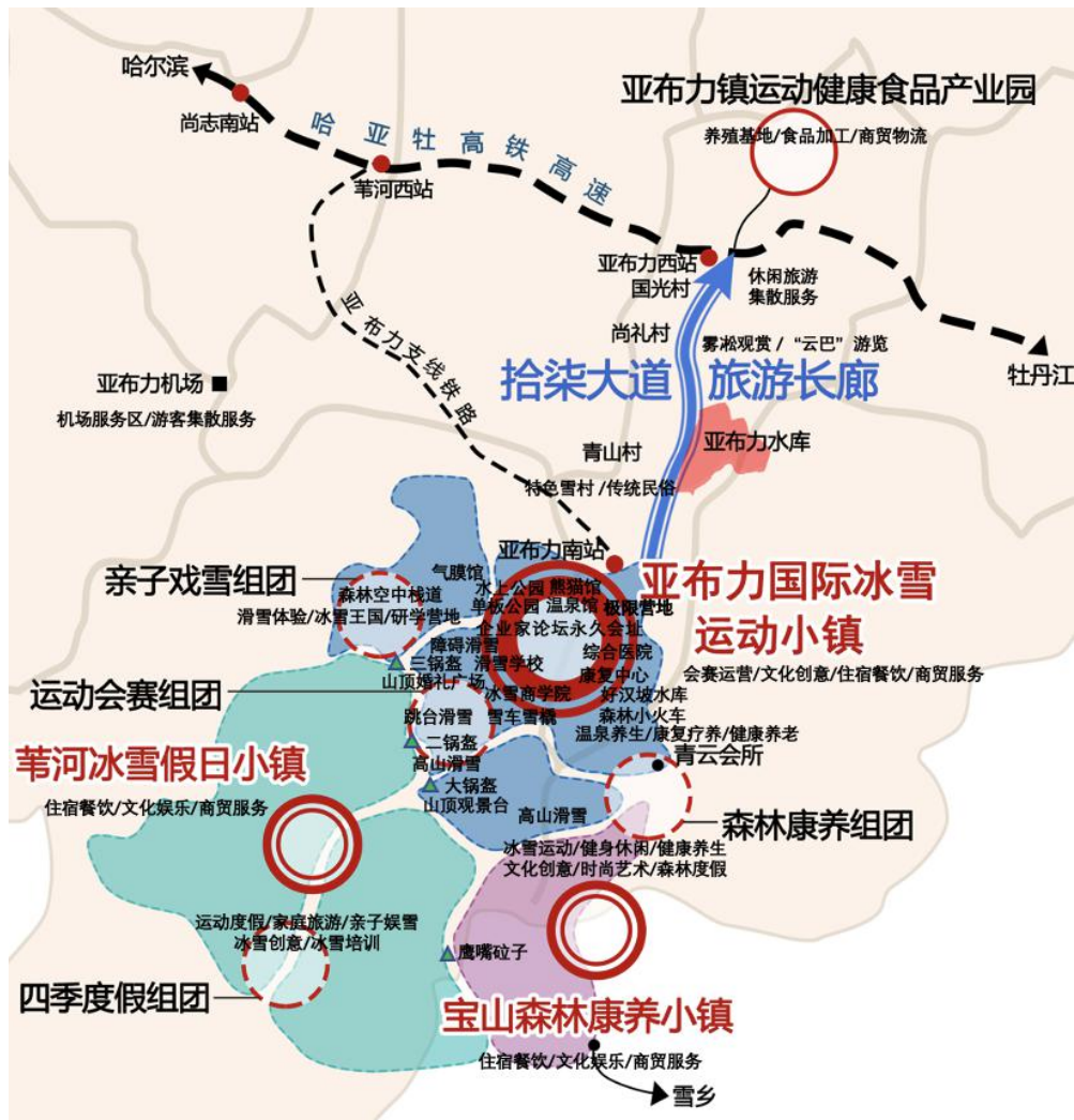
图2 亚布力产业项目布局图

训、教育普及、研学体验为主的教育培训产业链；以生态养生、康复疗养、健康养老、森林度假为主的森林康养产业链；以种植养殖、产品研发、生产加工、商贸物流为主的配套加工产业链。重点发展冰雪六大产业，促进冰雪产业集聚化、融合化、高端化、市场化发展，全面提升冰雪产业规模层级、供给水平和辐射能力，带动哈尔滨及沿线周边区域装备制造业、冰雪旅游、生态农业和现代服务业等产业结构调整 and 转型升级。